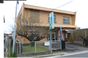
城陽作業所 市辺分室