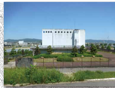
③ 京都府城陽排水機場