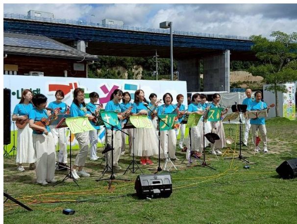
(参考写真) 前回ステージの様子