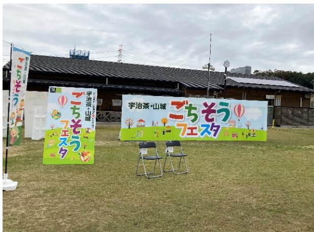
(参考写真) ステージのイメージ