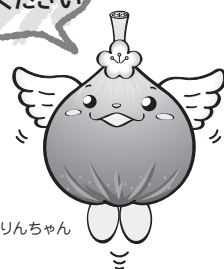
じょうりんちゃん