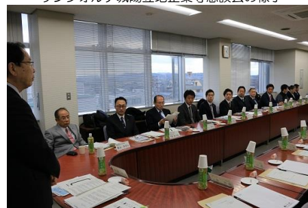
サンフォルテ城陽立地企業等懇談会の様子

出席者からは、「やり方はこれから考える必要があるが、提案には賛成である。」「情報交換の場として、このネットワークを活用していきたい。」などの意見があり、全会一致で承認されました。