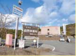
9 自然休養村管理センター