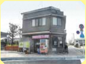
Q 玉水駅前休憩所 さくら