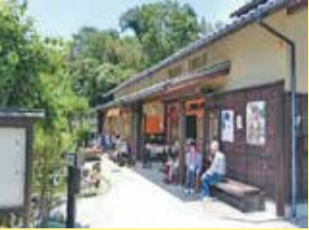
10 N 井手町 まちづくりセンター榑坂 山背古道の中間地点。春のは～ ふウォークのゴールとなります