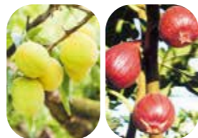
城州白とイチジク