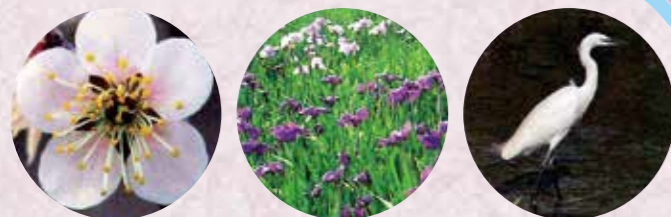
市の木 梅 市の花 花しょうぶ 市の鳥 しらさぎ