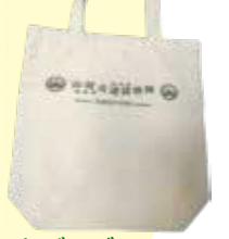
トートバッグ(2025年作成) 300円

※探検隊グッズについては、春のは〜ふウォーク、とことんウォーキングで販売します。 ※在庫がなくなり次第、終了とさせていただきます。