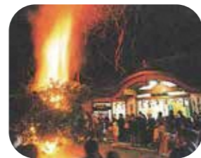
いごもり祭 (大松明)

木津川市 には、古来からの伝統行事がよく守り伝えられています。相楽神社では、1月15日に「御田」、2月1日に餅を花に見立てて奉納する「餅花」が行われます。2月の第3土日には涌出宮において南山城地方最古の奇祭といわれる「いごもり祭(居籠祭)」が行われます。「大松明」、「お田植」などの儀式は、室町時代中期の農耕儀礼の様子をよく伝えるものとして、国の重要無形民俗文化財に指定されています。「蟹の恩返し」の縁起で有名な蟹満寺では、4月18日に縁起に因み、生命の尊さに感謝する蟹供養放生会が行われます。 夏は、毎年、7月23日に泉橋寺で地蔵祭りが行われます。また、8月24日には、子どもが石地蔵のまわりを取り囲み数珠繰りが行われます。 秋は、10月に木津御輿祭が実施されます。秋の収穫を感謝して行われるまつりで、1トン以上もある布団御輿を「サーセヨ」の掛け声で担いでまわる姿は勇壮です。