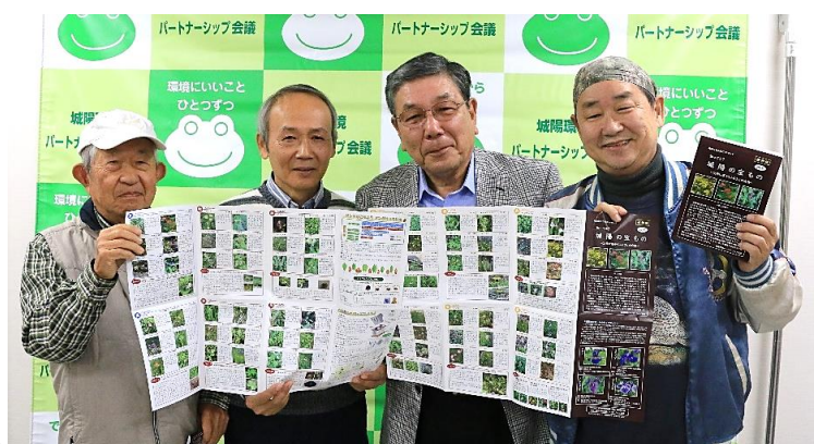
左から、井手生活・自然部会長、山村委員、大野会長、中川委員

※ガイドブックは、事務局(城陽市役所環境課)にて、お1人様につき1冊、配布しております。