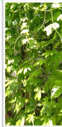
塚本 百合子 様 表題「グリーンカーテン。」

植物の種類: ゴーヤ、きゅうり 効果と感想 グリーンカーテンとして、目に涼やかさを、また、便利な新鮮野菜室として、機能しています。