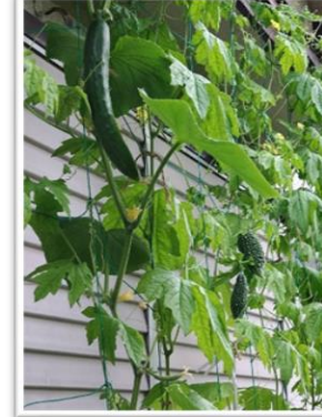
杉本 功 様 表題「キュウリとゴーヤでグリーンカーテン」

植物の種類: ゴーヤ 効果と感想 北向きの家の座敷に、昨年からグリーンカーテンとして部屋から見えるように3株のみ植えました。毎日部屋から朝から夕方まで観て癒されています。主人が亡くなり寂しいですが、毎日二人で観ているような想いがしています。今もさらさら〜と爽やかに実とグリーンが揺れています。