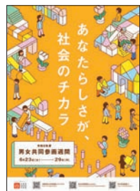
▲令和8年度ポスター

はれっとJOYO男女共同参画週間展示 場所: はれっとJOYO 期間: 6月23日(火)~7月22日(水)