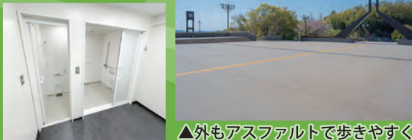
▲外もアスファルトで歩きやすく