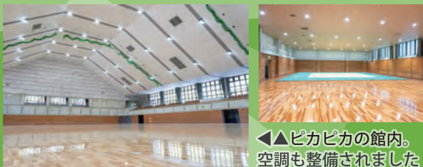
◀◀ピカピカの館内。空調も整備されました

競技場など全館に空調を整備し、トイレやシャワールームも綺麗にリニューアルするなど、より快適に利用できる施設となりました。また、更衣室には授乳室やおむつ交換台、トイレはベビーチェア付きの個室もあり、親子連れでも安心です！