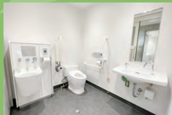
▲バリアフリートイレ