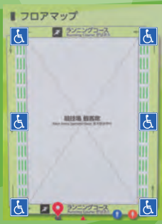
▲▼観客席の6カ所に車いすスペースを設置

観客席への階段に昇降機を設置し、観客席の6カ所に車いす用のスペースを整備しました。シャワールームも車いすに対応した他、オストメイトにも対応したバリアフリートイレも整備。よりさまざまな人が快適に利用できるようになりました。