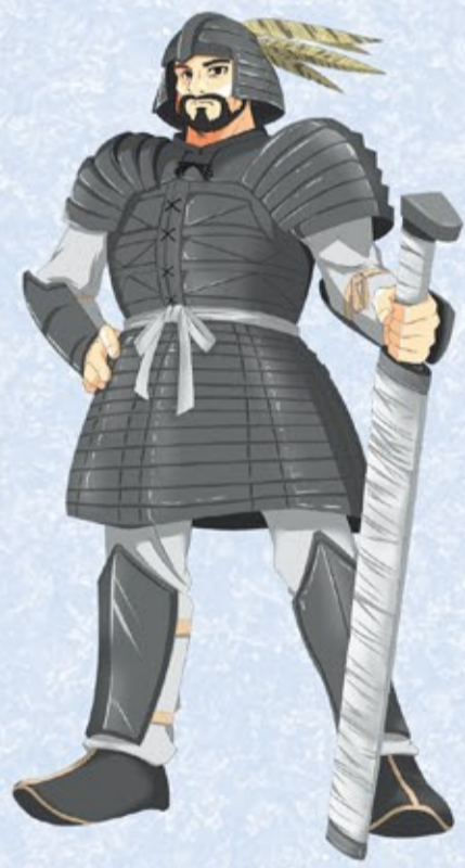
南山城地域を治めた大首長 (地域資源キャラクター)