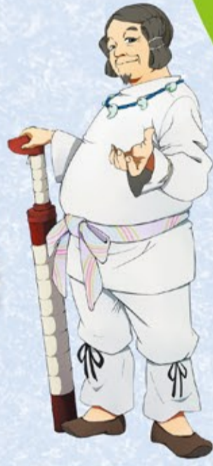
大首長の地域支配を支えた有力首長 (地域資源キャラクター)

令和8年 4月25日 ± ~ 6月21日 日 最終日 6月21日 日は 観覧無料