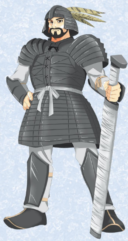
南山城地域を治めた大首長 (地域資源キャラクター)