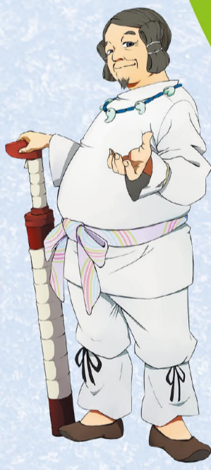
大首長の地域支配を 支えた有力首長 (地域資源キャラクター)

令和8年 4月25日 ± ~ 6月21日 日 最終日 6月21日 日は 観覧無料