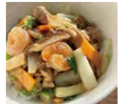
中華丼 1品で栄養バランスも ばっちり