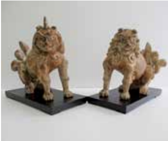
▲狛犬 室町時代 天満神社(中)所蔵・歴史民俗資料館寄託

城陽市中にある天満神社は旧中の産土神(うぶすな)で、龍福寺の北隣に鎮座しています。神社の周辺には黒土(くろつち)古墳群が存在し、平安時代に編み込まれた「和妙抄(わみょうしよ)