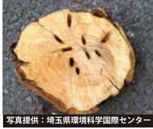
幼虫に食害された樹木の内部

公園や街路樹などのサクラ が加害されると 景観が悪化 し たり、 お花見を楽しむことが できなくな ってしまいます。