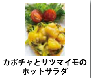
カボチャとサツマイモのホットサラダ