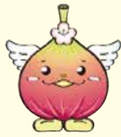
じょうりんちゃん