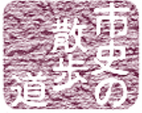
市史の 散歩 五里ごり館 (歴史民俗資料館) ☎(55)7611 No.401