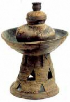
蓋付き壺が溶着した器台 (青山2号墳出土)

青山(かぶとやま)古墳群は、 城陽市観音堂にある日原神社裏山 の丘陵上に広がる古墳群です。昭 和41年、山砂利採取工事進行中に 横穴式石室の石組みが発見された