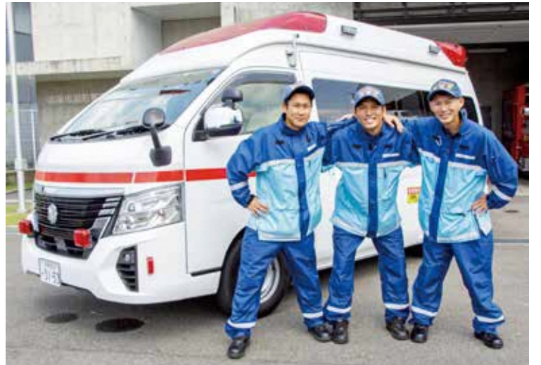
▲青谷消防分署の高規格救急車と救急隊員