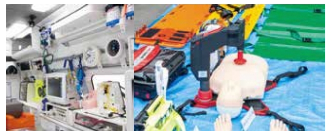
▲最新の医療機器やさまざまな資機材を搭載

今後も、新名神高速道路の全線開通に合わせて救急隊を増隊するなど、救急体制のさらなる充実に努めてまいります。