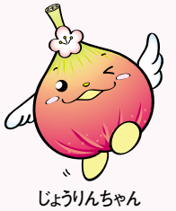
じょうりんちゃん