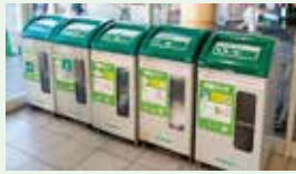
▲リサイクルボックス

③資源ごみの分別回収(5ポイント) アル・プラザ城陽内のリサイクルボックスに、対象の回収品を持ち込んでポイントをゲット!リサイクルボックスに設置している二次元コードを読み取ってください。 ※1人1日1回まで