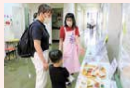
◀ 3歳児健診に来られたママに、減塩レシピを解説