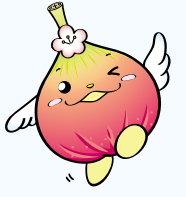
じょうりんちゃん