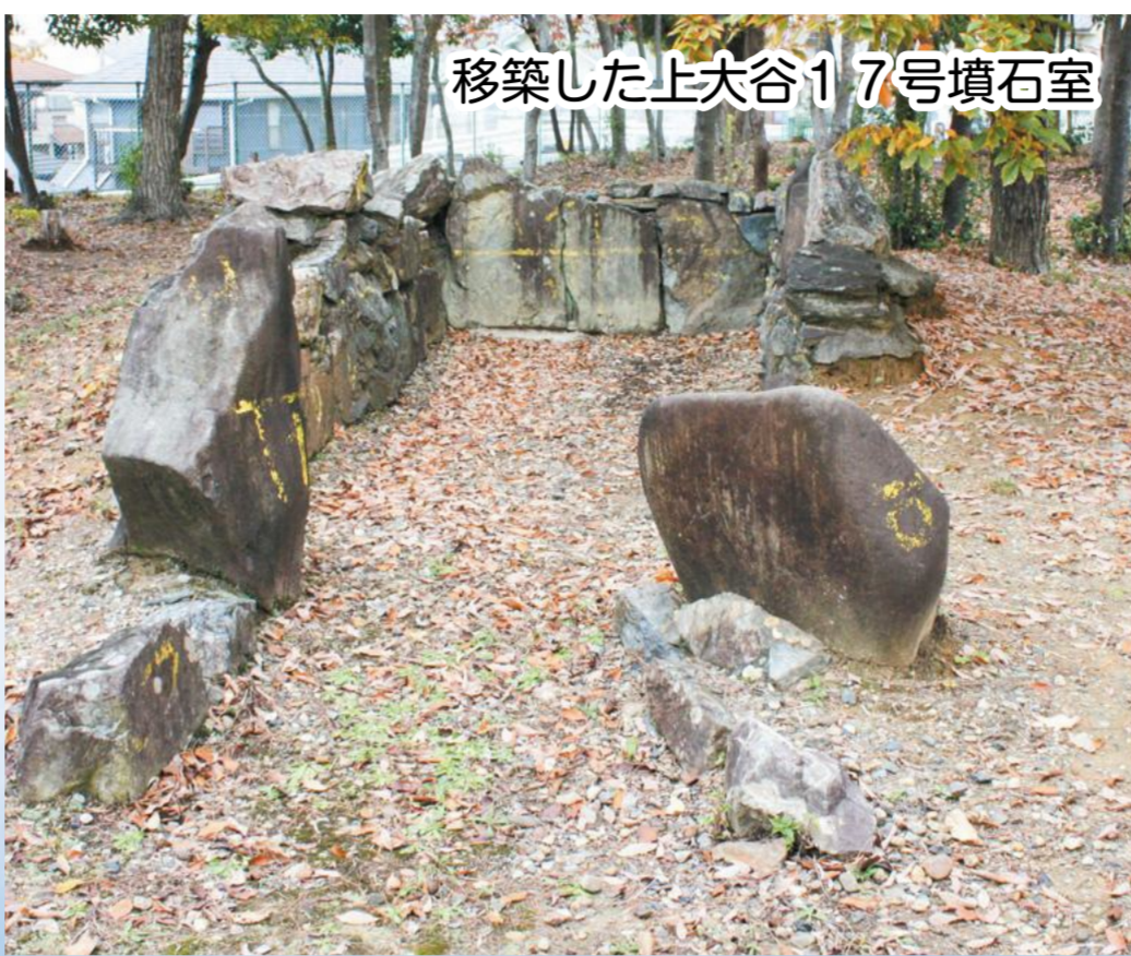
移築した上大谷17号墳石室