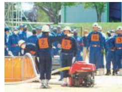
▲京都府消防操法大会

やサポートのおかげで、市消防操法大会で優勝し、府消防操法大会に出場することができました。この努力や経験は何にも代えがたい宝物であり、今後の消防団活動を行っていく上での自信となりました。