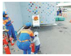
▲救急フェアで消火器の使い方をレクチャー

入団するまで知らなかったのですが、防災訓練などで消火器の使い方の講習なども行っているんですよ。