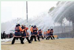
▲出初式の一斉放水の様子

月1回の定期訓練をはじめとする各種訓練のほか、春・秋の火災予防運動、年末警戒や出初式など活動は多岐に渡り、