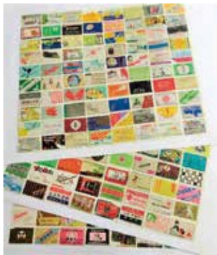
▶寄贈されたコレクションの一部