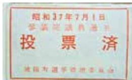
▲参議院議員選挙の投票後に配布されたマッチ(城陽町作成)