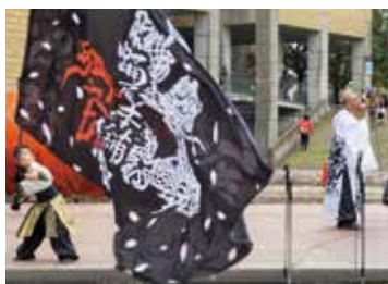
▲迫力の水上ステージ

プラムホール 城陽市音楽団演奏 暴太郎戦隊ドンブラザーズショー 城陽市文化芸術協会ステージ発表 城陽おかげ踊りを広める会 大奈ステージショー 西尾夕紀ステージショー