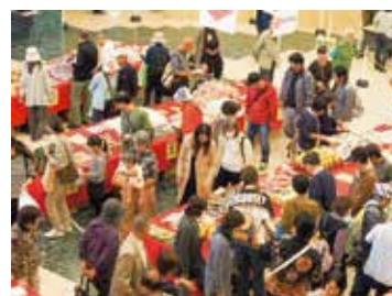
▲いいもの発見フェア

商工業者と市民の「ふれあい」と「交流」の場として、今年、3年ぶりにJOYO産業まつりが開催されます。ステージイベントや全国の特産品が集まるフェア、子ども向けの催しも盛りだくさん!地域を支える商工業者との交流を楽しみませんか。ぜひお越しください!