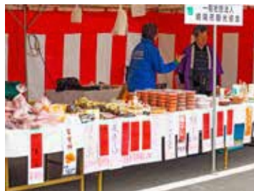
▲商工業製品の展示・販売

市民プラザ いいもの発見フェア (全国各地の特産品の紹介・販売) 燦彩糸(さんさいし)商品の販売 刑務所作業製品の展示・販売