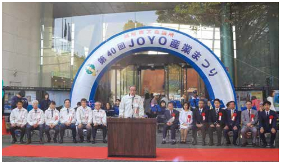
▲オープニングセレモニー(令和元年度の様子)