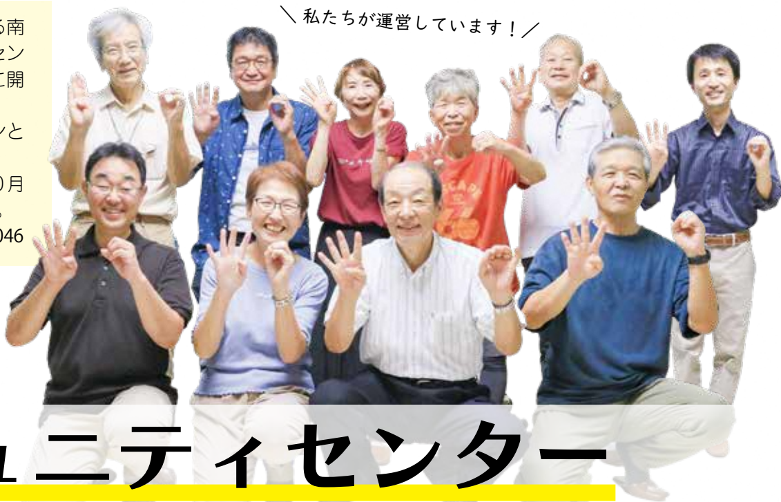
「私たちが運営しています！」