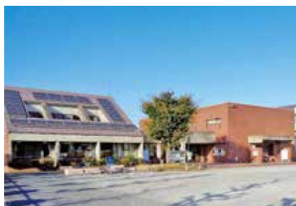
▲開館から40年目を迎える南部コミセン

行政ではなく、市民が自ら地域の施設の運営を担うこの方式は、“城陽方式”とも呼ばれ、各方面から高い評価を受けています。