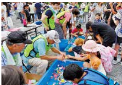
▲子どもや家族連れでにぎわう夏まつり