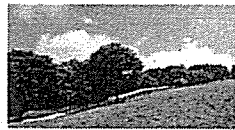
ローコースライダー