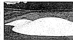
ふわふわのホーム