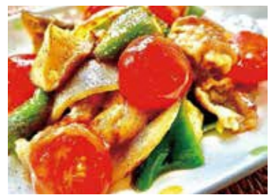
主菜の塩分1.0グラム! 豚肉と万願寺のレモン炒め