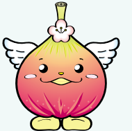
じょうりんちゃん