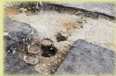
久津川車塚古墳東くびれ部 中段テラス埴輪列