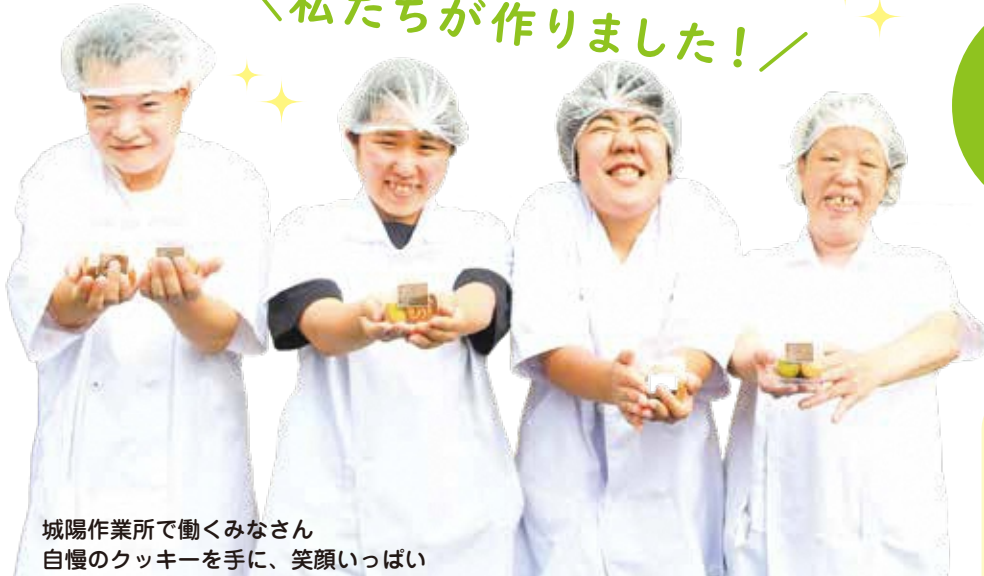
城陽作業所で働くみなさん 自慢のクッキーを手に、笑顔いっぱい

市内にある障がい者就労施設などでは、日々、障がいのある人たちが、製品の製造や販売などをされています。障がい者のみなさんが作られた製品を手に取り、購入することで、作り手であるみなさんの工賃アップにつながり、「自立」や「社会参加」という「生きがい」にもつながります。