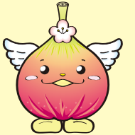
じょうりんちゃん