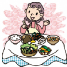
妊娠中の食生活やこ

れから誕生する赤ちゃんの離乳食についてお話しします(個別栄養相談・健康相談あり)。 ▼日時 11月26日(金)午後1時15分～4時 ▼場所 保健センター ▼対象 妊婦さんとその家族 ▼定員 10組 ※初めての人の優先費用 無料 ▼持ち物 母子健康手帳、筆記用具 ※保育なし 国・国11月2日(火)19日(金)に保健センター ☎(55)1111 へ電話・直接