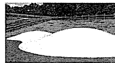
水むすびドーム 遊力満点のウォーターゾーンです。親子連れが、水遊びを楽しむことができます。