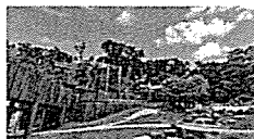
ハイクーパー車 アメリカのハイクーパー車をイメージした、本格のミニステックです。