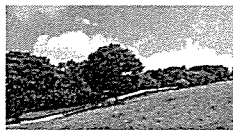
ローラー coaster 土曜日のみ運行です。遊力満点で、親子で楽しめる施設です。