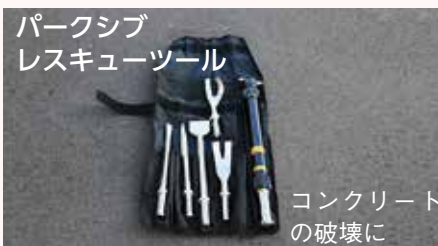
パークシブレスキューツール