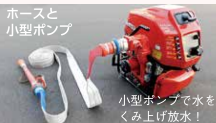
ホースと小型ポンプ