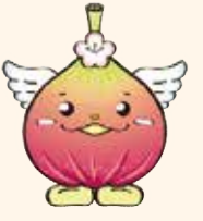
じょうりんちゃん