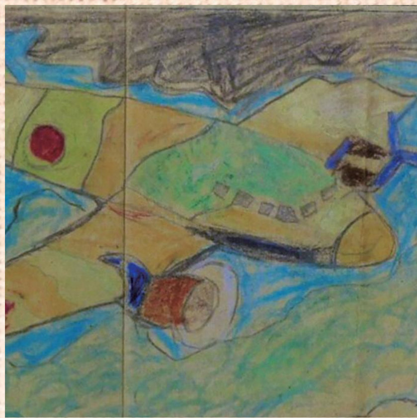
久津川国民学校児童の慰問文(部分) 立命館大学国際平和ミュージアム蔵