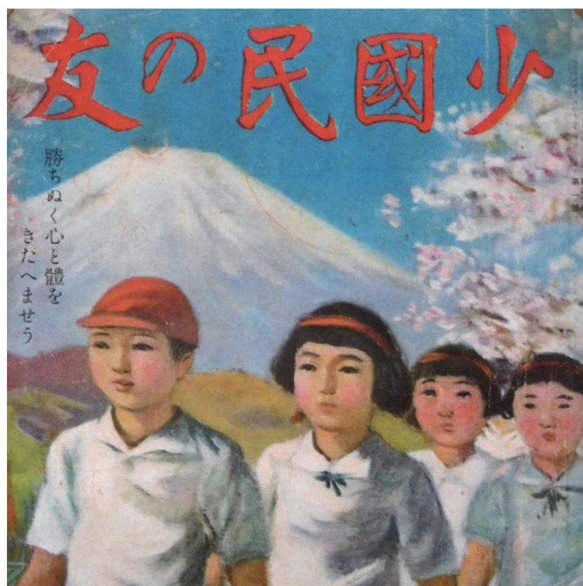
『少国民の友 四月号』(部分) 南丹市立文化博物館蔵