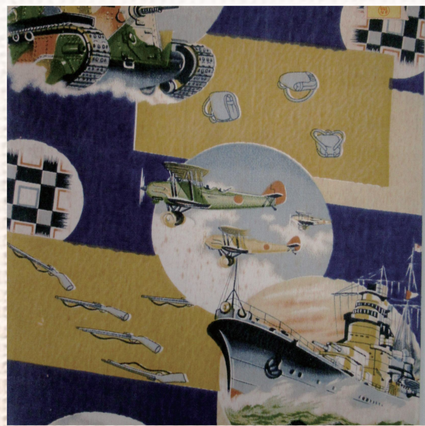
和載用へら台(部分)