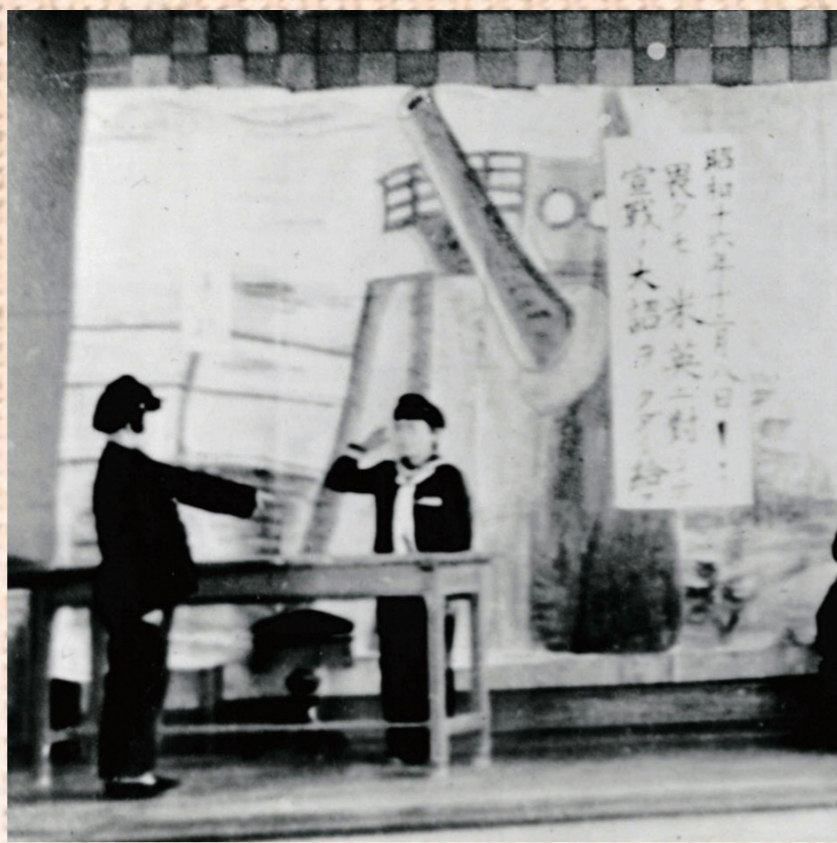
寺田国民学校の学芸会「水兵の母」(部分)