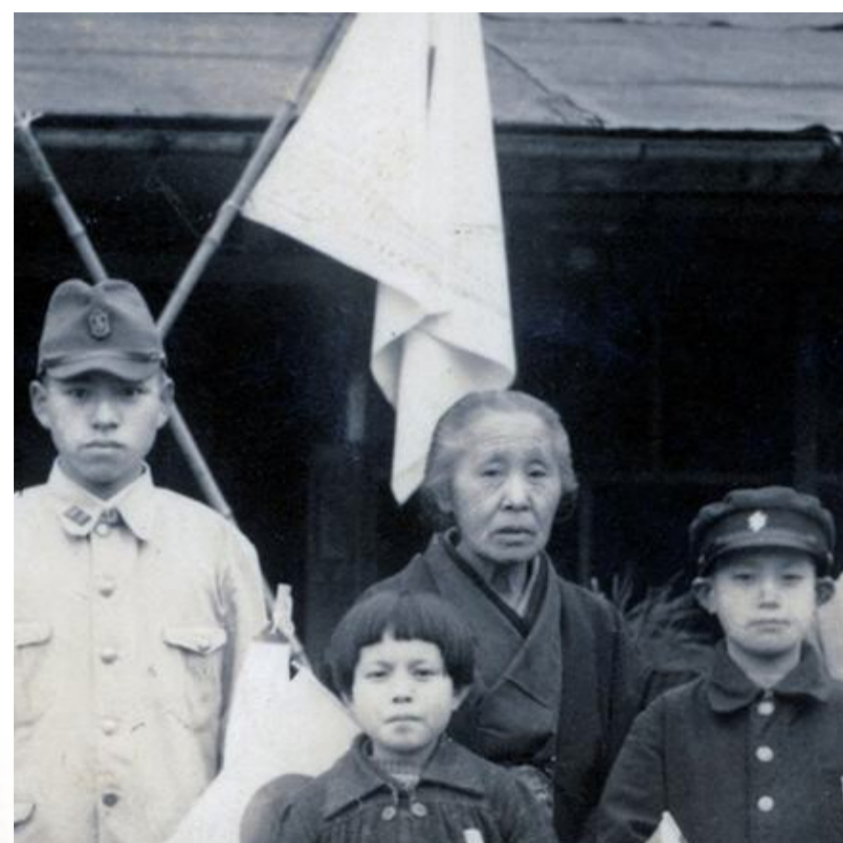
出征時記念写真(部分)