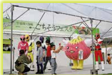
▲宇治茶・山城ごちそうフェスタで盛り上がるステージ

11 月、市では初開催となる関西茶業振興大会が文化パーク城陽で行われました。大会の消費拡大イベント「関西お茶まつりin京都城陽」では、市からは、関西茶品評会で産地賞を獲得した最高品質の抹茶を提供するなど、市特産のてん茶の魅力を発信しました。