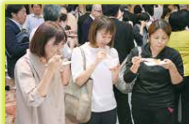
▲イチジク料理に舌鼓みを打つ参加者