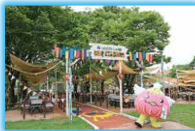
▲手軽にバーベキューが楽しめるBBQスタジアム