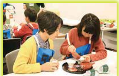
▲関西お茶まつりin京都城陽の様子