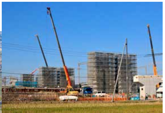
▲建設が進む新名神高速道路 ◀城陽IC上空から