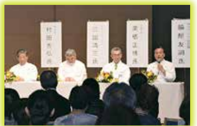
▲城陽イチジクのお祭りで講演する料理人のみなさん