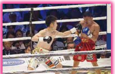
▲6度目の防衛戦で有利に試合を進める寺地拳四朗選手