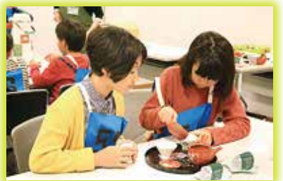
▲関西お茶まつりin京都城陽の様子