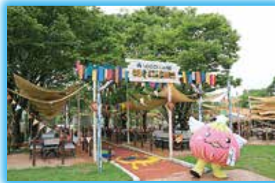
▲手軽にバーベキューが楽しめるBBQスタジアム