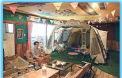
▲アイリスイン城陽では屋内テント泊が楽しめます