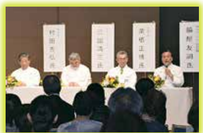
▲城陽イチジクのお祭りで講演する料理人のみなさん