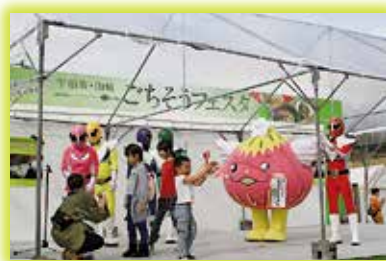
▲宇治茶・山城ごちそうフェスタで盛り上がるステージ

11 月、市では初開催となる関西茶業振興大会が文化パーク城陽で行われました。大会の消費拡大イベント「関西お茶まつりin京都城陽」では、市からは、関西茶品評会で産地賞を獲得した最高品質の抹茶を提供するなど、市特産のてん茶の魅力を発信しました。