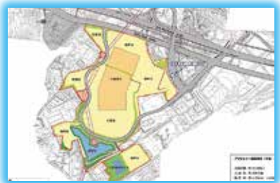
▲(仮称)京都城陽プレミアム・アウトレット開発基本構想土地利用構想図