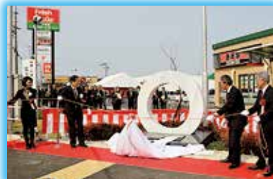
▲サンフォルテ城陽記念モニュメント除幕式を開催

市 の総面積の約13%を占める東部丘陵地の城陽スマートIC(仮称)に隣接する長池地区では、三菱地所・サイモン(株)が(仮称)京都城陽プレミアム・アウトレットの進出を計画しています。10月には、店舗面積を約30,000平方メートル、店舗数を約150とする基本構想が示されました。開業は令和6年春頃を予定されています。