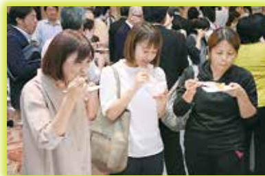
▲イチジク料理に舌鼓みを打つ参加者