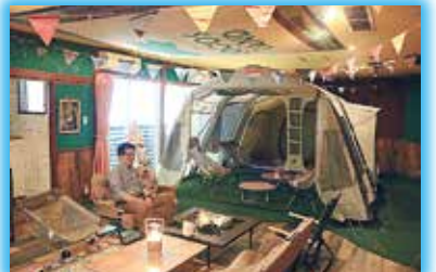
▲アイリスイン城陽では屋内テント泊が楽しめます