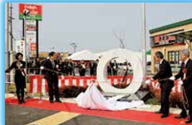
▲サンフォルテ城陽記念モニュメント除幕式を開催

市 の総面積の約13%を占める東部丘陵地の城陽スマートIC(仮称)に隣接する長池地区では、三菱地所・サイモン(株)が(仮称)京都城陽プレミアム・アウトレットの進出を計画しています。10月には、店舗面積を約30,000平方メートル、店舗数を約150とする基本構想が示されました。開業は令和6年春頃を予定されています。