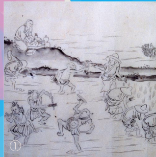
①～⑤、⑧ 「四季耕作図巻」(部分) ⑥、⑦ 「榎良翁句画賛」(部分) いずれも堀家文書