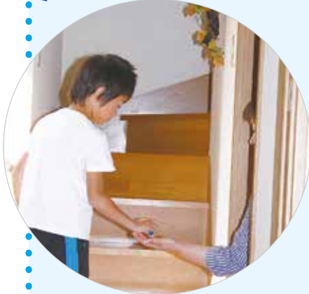
▲「はい、どーぞ！」 スーパーボール、うまくキャッチできるかな