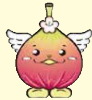
城陽イメージキャラクター「じょうりんちゃん」