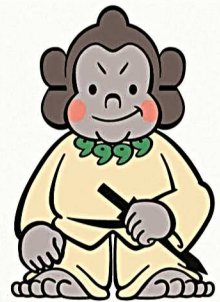
資料館マスコット「ごりごりくん」

ごりごりくんは心優しい豪族ゴリラです。「五里五里の里」の「ごり」とその語感からゴリラをキャラクター化したものです。古墳・遺跡の多い城陽市の特徴から古墳時代を思わせる姿になっています。