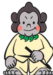
資料館マスコット「ごりごりくん」