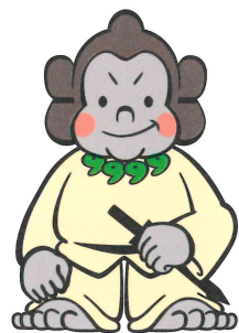
資料館マスコット「ごりごりくん」

ごりごりくんは心優しい豪族ゴリラです。 「五里五里の里」の「ごり」とその語感からゴリラをキャラクター化したものです。 古墳・遺跡の多い城陽市の特徴から古墳時代を思わせる姿になっています。