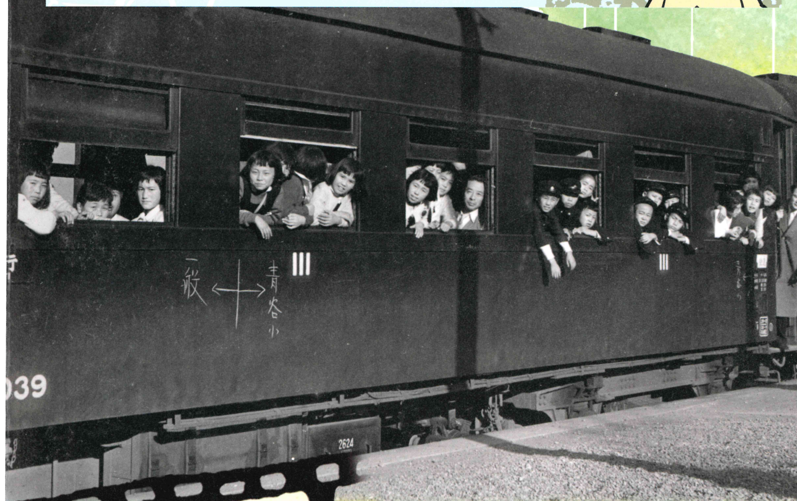
青谷小学校修学旅行の列車 昭和29年

城陽市歴史民俗資料館(文化パルク城陽 西館4階) 〒610-0121 京都府城陽市寺田今堀1番地 TEL0774-55-7611 FAX0774-55-7612