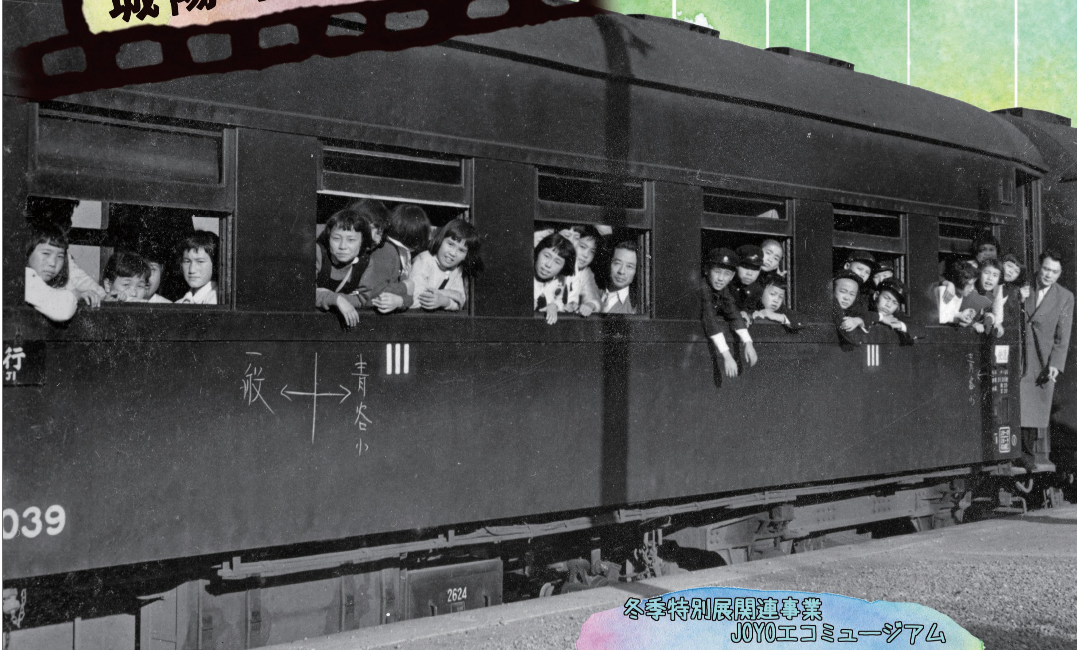
青谷小学校修学旅行の列車 昭和29年