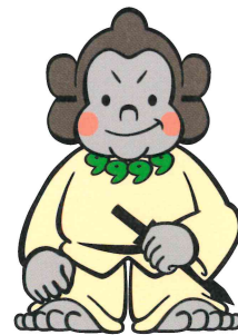
資料館マスコット「ごりごりくん」

ごりごりくんは心優しい豪族ゴリラです。 「五里五里の里」の「ごり」とその語感からゴリラをキャラクター化したものです。 古墳・遺跡の多い城陽市の特徴から古墳時代を思わせる姿になっています。