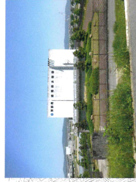
③京都府城陽排水機場