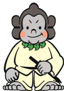
資料館マスコット「ごりごりくん」

ごりごりくんは心優しい豪族ゴリラです。「五里五里の里」の「ごり」とその語感からゴリラをキャラクター化したものです。古墳・遺跡の多い城陽市の特徴から古墳時代を思わせる姿になっています。