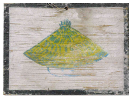
編笠図絵馬 天理大学附属天理参考館蔵