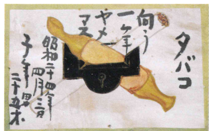
心字に煙草鍵図絵馬 天理大学附属天理参考館蔵

絵馬には願いに応じて様々な動物やモノや登場します。1～9までの絵馬にはどのような願いが込められているのかあてよう！下のAからIの中から選んでね。