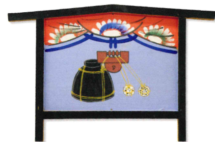
賭事断ち図絵馬 天理大学附属天理参考館蔵