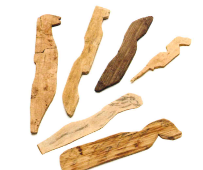
馬形 奈良文化財研究所蔵