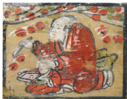
幼児剃髪図絵馬 天理大学附属天理参考館蔵