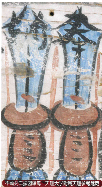
不動剣二振図絵馬 天理大学附属天理参考館蔵