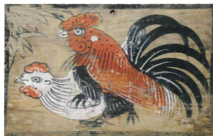
鶏図絵馬 天理大学附属天理参考館蔵