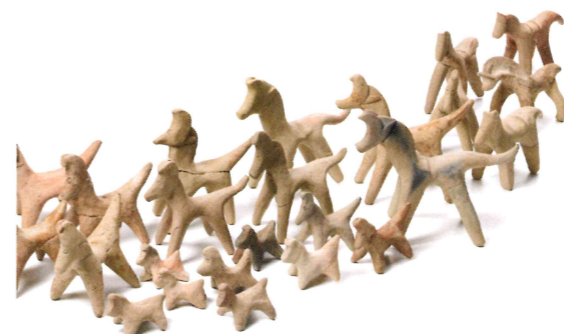
土馬 奈良文化財研究所蔵

日本では昔から馬は神さまの乗りものと考えられてきました。そのため願いをかなえるために絵馬の他にも土馬や馬形などが製作されました。