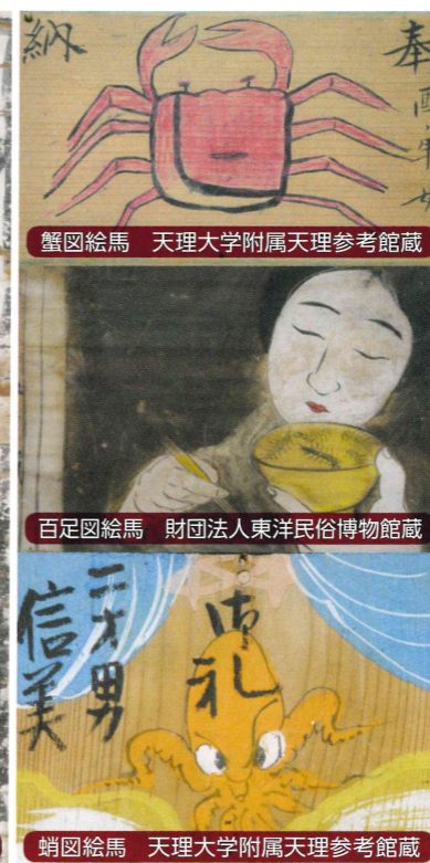
蟹図絵馬 財団法人東洋民俗博物館蔵