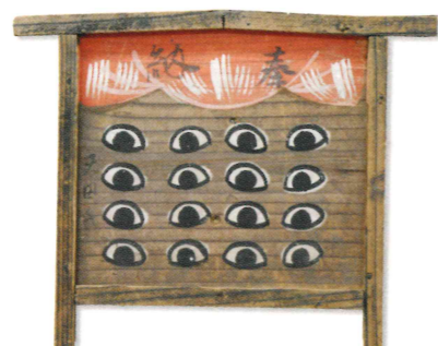
八目図絵馬 天理大学附属天理参考館蔵