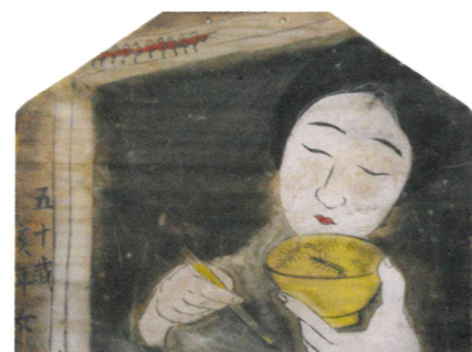
百足図絵馬 財団法人東洋民俗博物館蔵