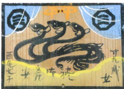
鰻三匹図絵馬 天理大学附属天理参考館蔵