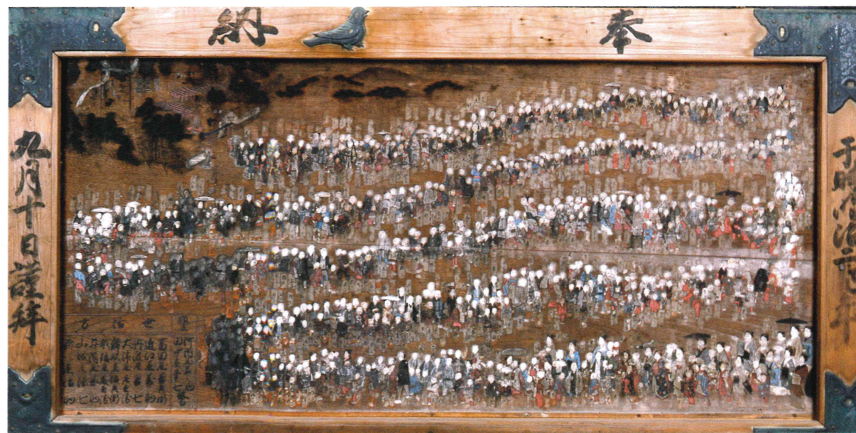
子育て祈願絵馬 三宅八幡宮蔵 重要有形民俗文化財

子供の守り神として知られる三宅八幡宮には大型の絵馬がたくさん奉納されています。この絵馬は明治2年(1869)9月に奉納されたもので、三宅八幡宮に参詣する人々を描き、大きさが縦約1メートル、横約2メートルもあります。この絵馬にはたくさんの方が登場していますが、合計すると何と、638人もの方が描かれています。この絵馬は2月13日から展示するので五里ごり館で数えてみてね。