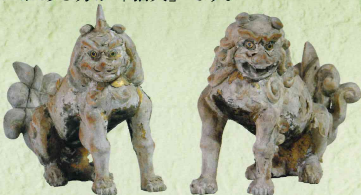
③ 中天満神社(城陽市) 木造 獅子・狛犬