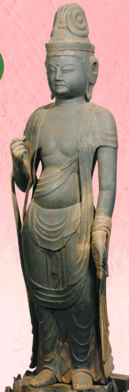
⑥ 西福寺(井手町井手) 木造 聖観音立像