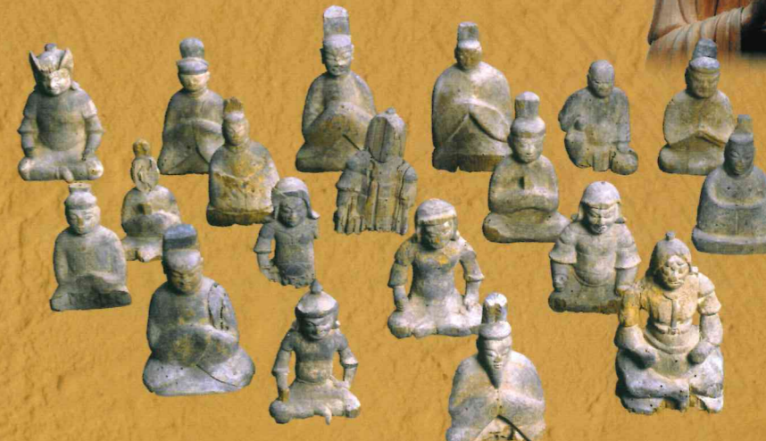
巨椋神社(城陽市) 木造大將軍神像