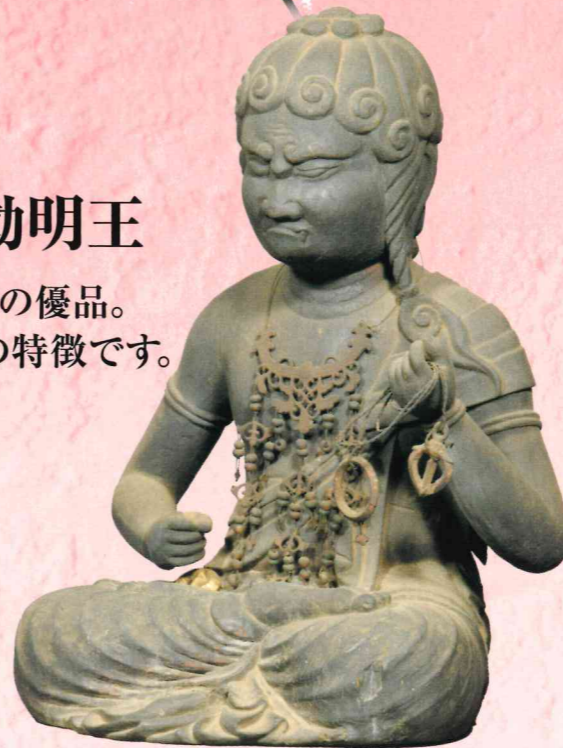
⑤ 西福寺(井手町井手) 木造 不動明王坐像