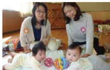
0歳児さんもお待ちしています

午前中から夕方にかけて一日中親子で過ごせる施設は、子育て世代の人たちにとって待ちに待った場所ではないでしょうか。子どもが小さい時にしかできないことを親子で一緒に体験できそうですね。