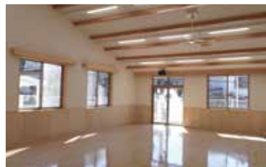
多目的ホールはどなたでもさまざまな事業にご活用いただけます