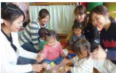
笑顔あふれる「あそびのひろば」