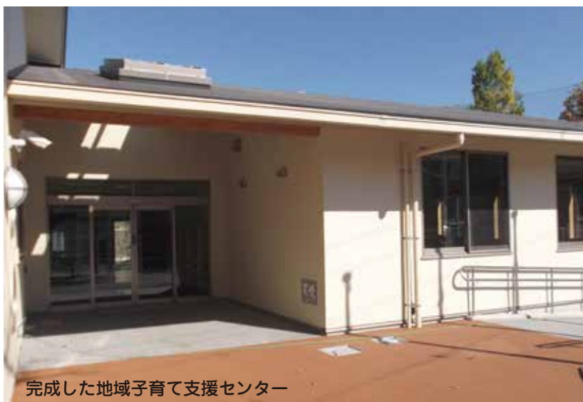
完成した地域子育て支援センター

お問い合わせは 子育て支援課 (〒610-0195 城陽市寺田東ノ口16番地、17番地 ☎56-4036 FAX56-3999)へ