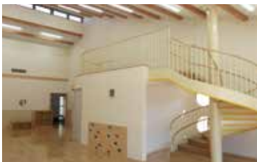
プレイルームのロフトは食事スペース。その下は図書室です

「子育て中のみなさん!ぜひ、ほっと一息つきにお越しください。」地域子育て支援センターは、これからも子ども同士、親同士、地域のみなさんと子育て家庭をつなぐ「架け橋」となるよう、がんばります。