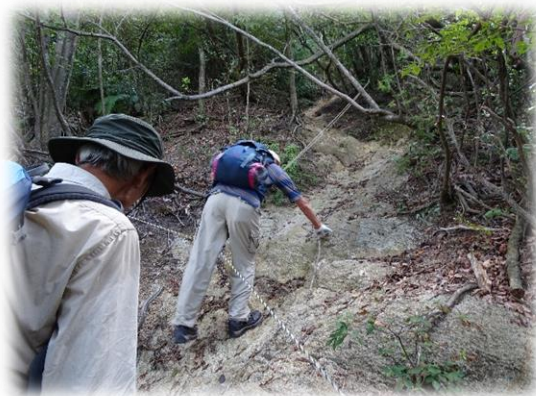
ちょっと急な登りもあります。