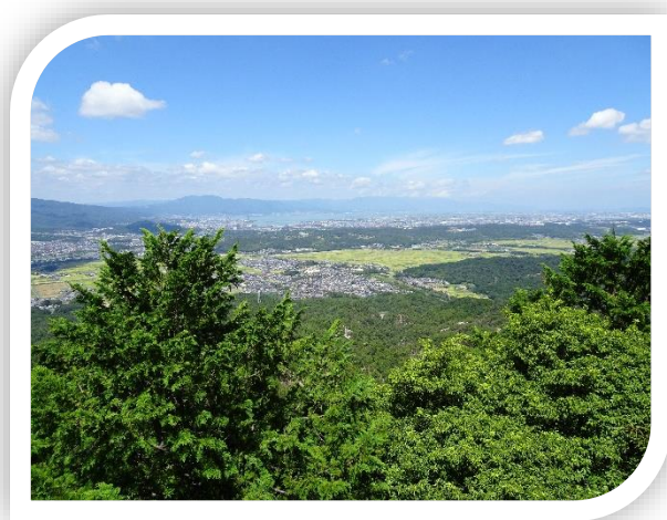
琵琶湖方面がよく見えます。