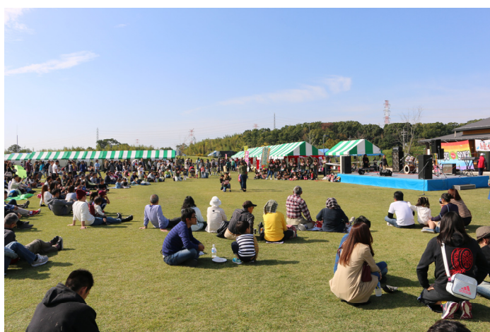
城陽五里五里の丘で開催される城陽市緑化フェスティバル

森林、公園、緑地、小中学校などの緑の多い場所を、街路樹や河川沿い、民有地などの緑で結び、生物多様性に配慮したネットワークの創出をめざすもの。