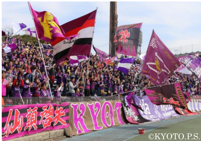
京都サンガ F.C.サポーターの応援風景