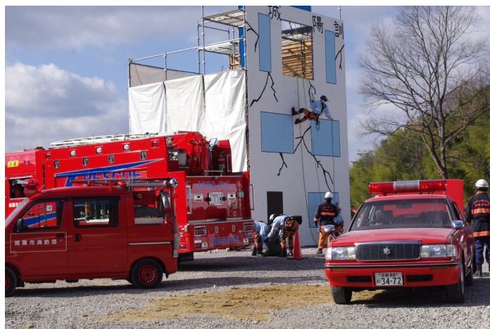
平成26年度城陽市総合防災訓練（城陽訓練ビル訓練〈救出・救護訓練〉より）