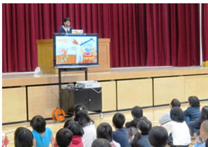
司書による読み聞かせ

生徒指導上の問題対策のために教員免許を持つ者を学校に配置。校内外の巡視、校内指導体制の補助等を行う。