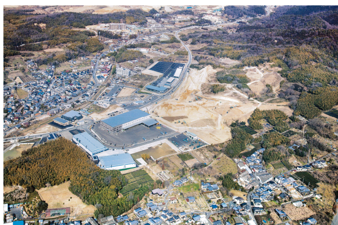
京都山城白坂テクノパーク（平成 29 年 2 月時点）