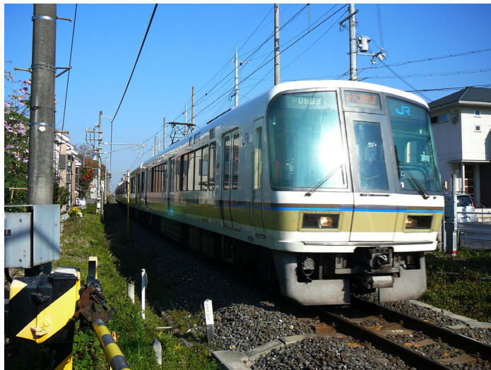
複線化事業が進むJR奈良線