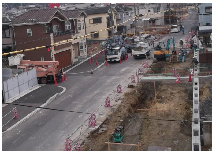
(都) 塚本深谷線 (工事中)