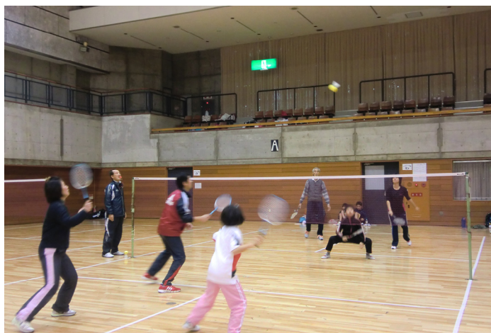
ファミリーバドミントン大会の様子