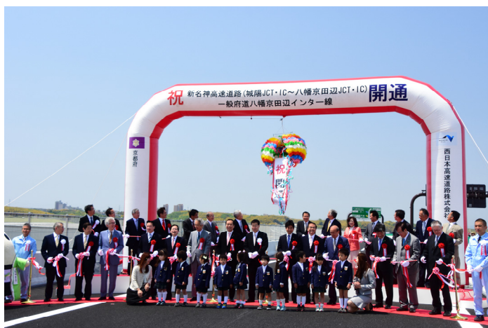
新名神高速道路（城陽 JCT・IC～八幡京田辺 JCT・IC）開通式典