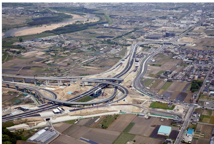
新名神高速道路 城陽 JCT・IC (平成 29 年 5 月時点)