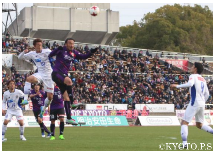
京都サンガ F.C.ホームゲーム