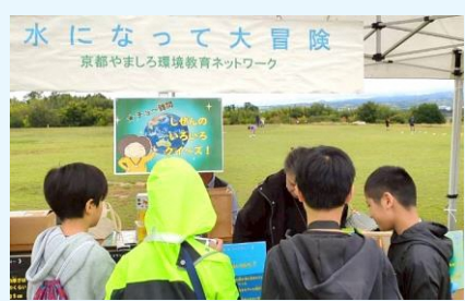
京都やましろ環境教育ネットワークが企画されている「水になって大冒険」のワークショップを体験します