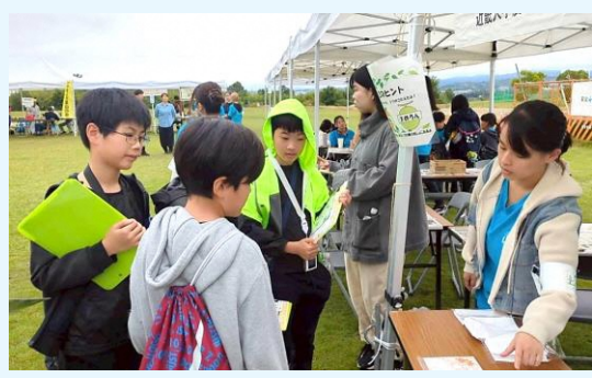
スタンプラリーでみどりについて学びます