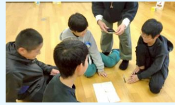
なかなか海にたどりつかなかつたねと検証中