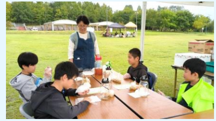
城陽の特産品「梅」をつかって梅シロップづくり