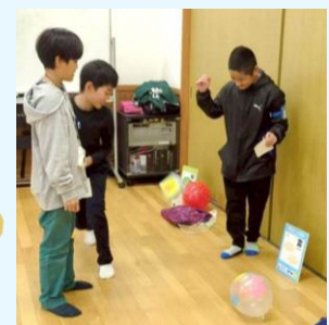
サイコロを振って、水の粒の旅のイメージがわき海(ゴール)を目指します