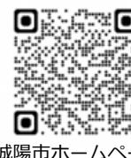
城陽市ホームページ