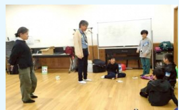
ゲームの説明を聞きます ※水の循環を体験するゲーム