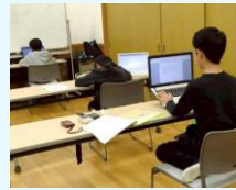
取材後、メモをまとめてSNSに投稿する文章を作成