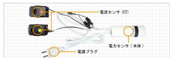
省エネナビ 電力センサ