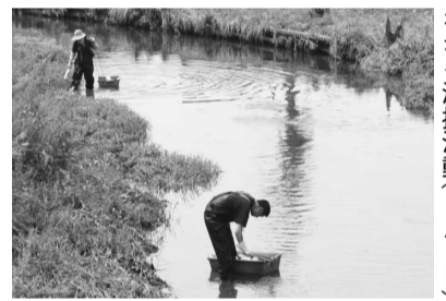
「水辺で遊べる古川をつくる会」の第2日曜日に行われる清掃活動(6月8日)

市では、年5回の水質検査を市内8河川の上流と下流16箇所で行い、その結果を、自然環境を守るまちづくりを生かしています。平成19年度の水質検査の結果を、川の水の汚れ具合の目安を表すBOD値でみてみると、中村川の下流、嫁付川の上・下流の3箇所が環境基準値の10mg/Lを超えていたが、市内全体では年々水質がきれいになってきています。