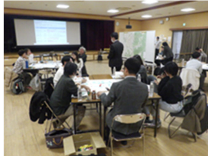
まちづくり意見交換会の実施

市民・市民団体をはじめ、まちづくりに関わる事業者や学識経験者など、様々な関係者と連携・協働したまちづくりの推進には、市民や市のまちづくりに関心のある方などが集まって実施する意見交換会などの手法が考えられます。